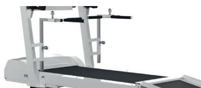
STANDARD Barres réglables en hauteur