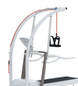
OPTION Arceau de sécurité