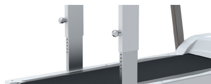
OPTION Barres réglables